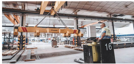
Lasercor 400 16,000 1 23